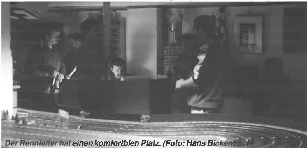
Der Rennleiter hat einen komfortblen Platz.

Inzwischen zählt der Club bereits elf feste Mitglieder, und in der Vorweihnachtszeit des letzten Jahres faßte man den Entschluß, eine komplett neue Anlage zu bauen. Da die Carrera Freunde Schwerte auch regelmäßig auf anderen Bahnen anzutreffen sind, haben sie dadurch eine Menge an po-